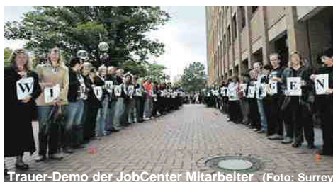
Trauer-Demo der JobCenter Mitarbeiter

Zusagen des Bundes, ein Großteil könne weiterarbeiten, gelten nicht mehr. Nur 70 Männer und Frauen haben die Aussicht auf einen neuen Arbeitsvertrag. Der Rest demonstrierte mit einem Trauerzug vor dem Arbeitsamt Hannover in der Brühlstraße gegen die Misere.