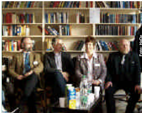
Führungriege fairKauf eG (Pressetermin 14.01.2008)