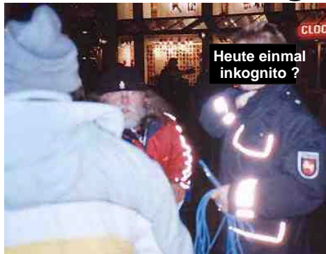
Mikrofonkabel, Eigentum der Kundgebung

Nach diesem Schnappschuss, der das Konfiszieren des “offenen Mikrofones” dokumentiert, stürzte sich der namenlose Polizeibeamte auch noch auf den Fotografen. Das Bild enthält nur einen Ausschnitt des dokumentierten Geschehens. Es wurde bewusst kein Porträt-Bild geschossen. In einem Gruppenbild sind auch Polizeibeamte Teil der Öffentlichkeit, haben keine Berechtigung, Fotos zu verbieten. Das Verhalten des Beamten, sein Versuch die Kamera einzuziehen, war ein Übergriff. Ebenso bestand aus der Sicht der Kundgebungsteilnehmer kein Anlass, das Mikrofon zu beschlagnahmen. Der handelnde Polizist war nicht einmal beauftragt, die Aufsicht über die Versammlung zu führen. Diese Aufgabe hatte ein anderer Beamter, der bereits vor Kundgebungsbeginn die Lage besprach, aufgrund der bisherigen friedlichen Montags-Versammlungen auch keinen Anlass sah, selbst bis zum Ende der Kundgebung zu verweilen. Mit dem Eingriff in die friedliche Kundgebung mit dem für alle offenen Mikrofon löste der namenlose Beamte Alarm aus, so dass mehrere Streifenwagen “zu Hilfe” eilten. Ein Eigentor für die Ordnungsbehörde ? Mit dem Blaulichteinsatz von 4 Streifenwagen und der Abschottung des Wagens des konfiszierenden Beamten wurde der Zorn der in ihrer friedlichen Kundgebung gestörten Menschen mächtig